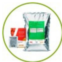
Tautiaineet ja kasvunparanteet