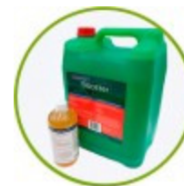
Carbon cick booster