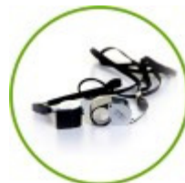
Luupit ja mikroskoopit